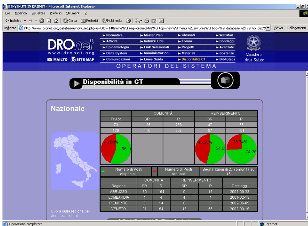
Fig. 1: Schermata della disponibilità in CT visualizzabile su Dronet

quadro d'insieme sia a livello di singola regione che nazionale, può risultare utile anche ai funzionari regionali addetti per monitorare l'andamento degli invii in comunità